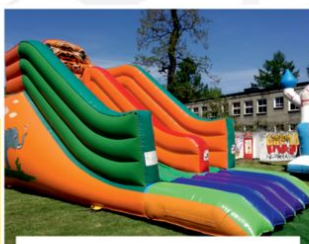
DMUCHAŃCE DLA DZIECI