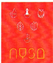
Wersja 5 kolor