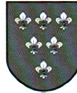
Wersja 2 czarno - biała