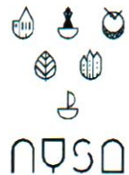
Wersja 5 czarno - biała