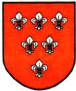
Wersja 2 kolor