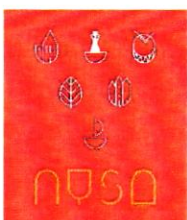
Wersja 6 kolor