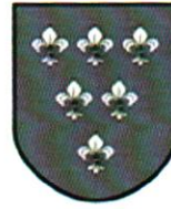
Wersja 1 czarno - biała